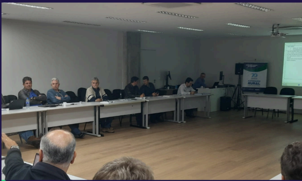
SEAGRI PROMOVE SEMINÁRIO DO PROGRAMA DE SEGURANÇA HÍDRICA NA AGRICULTURA